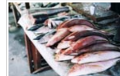
Methylquecksilber kann sich entlang der Nahrungskette anreichern

7.1 Quecksilber tritt auf natürliche Weise in unterschiedlichen chemischen Formen in der Umwelt auf. Elementares Quecksilber ist die Form, die in Amalgamen verwendet wird. In der Umwelt sind die gängigsten Formen anorganisches und organisches Quecksilber. Natürliche Vorgänge (z.B. die Verwitterung von Gesteinen) und menschliche Aktivitäten (z.B. die Verbrennung von Brandstoff und Abfall und, in einem geringeren Maße, die Verwendung und Entsorgung von Amalgamen) können verschiedene Formen von Quecksilber in die Natur freisetzen.